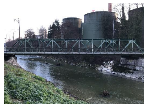
Emmebrücke vor der Sanierung