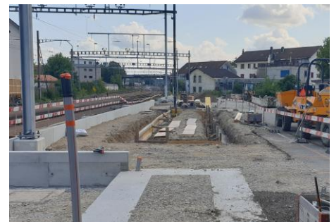
Umbauarbeiten beim Bahnhof Biberist Ost

Infos zum Bauprojekt: bls.ch/bauprojekte