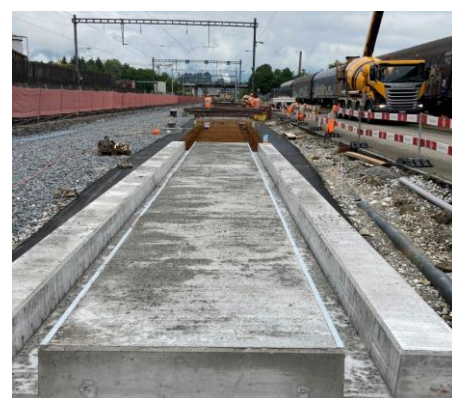
Bauarbeiten neues Betonverladegleis entlang Privatstrasse