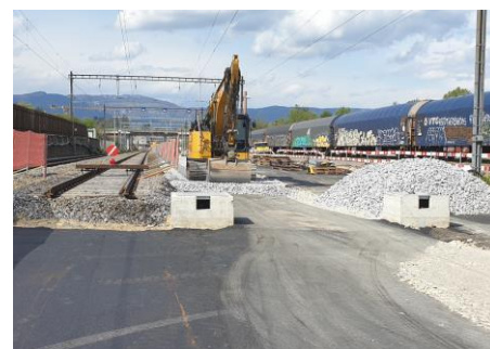
Gleisbauarbeiten südlich Strassenüberführung Gerlafingerstrasse

Der BLS Kundendienst ist täglich zwischen 7.00 und 19.00 Uhr für Sie da. Sie erreichen uns unter: +41 (0)58 327 31 32 oder über unser Kontaktformular auf bls.ch/kundendienst